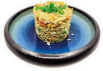
43. Yakimeshi Arroz frito con verduras 🍴 🌱 🍴 🍷