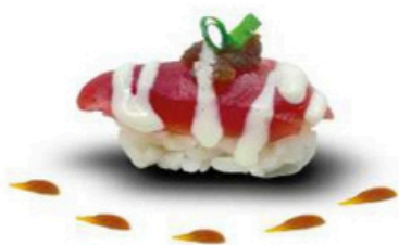
121. Maguro Gourmet