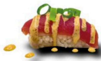
124. Niguri de Atún Spice