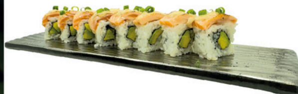
228. Fire Salmon 4 unds Uramaki con aguacate y salmon flambeado con salsa picante