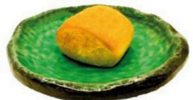
35. Pan Chino Frito