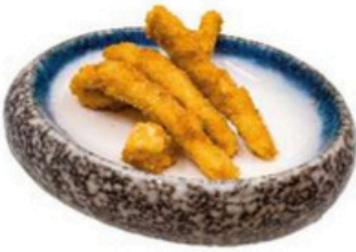
40. Tori Katsu Palitos de pollo empanado 🍴 🍷