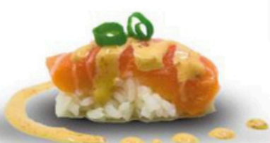
129. Niguri de salmon Spice