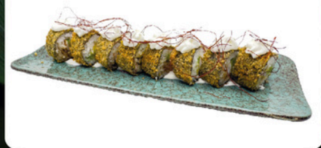
203. California Frito 4 unds Maki empanado con pollo y mango, con topping de philadelphia