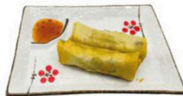
22. Rollito Primavera Verduras