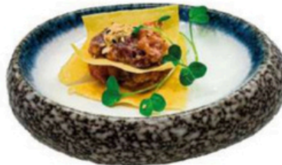
166. Sandwich Duo Con salsa de la casa