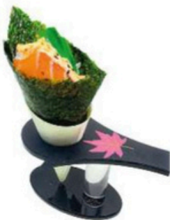
112 Temaki De salmon