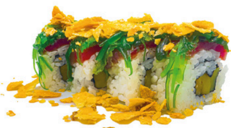
230. Okayama 4 unds Uramaki de mango con topping de atun y goma wakame con teriyaki