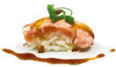
123. Niguri Aburi de salmon