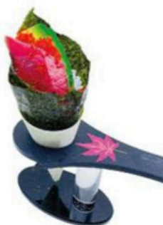
113 Temaki De atún