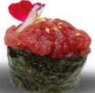
108. Gunkan de Atún Atún picado