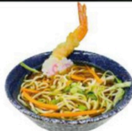
12. Tempura Ramen Caldo de Bonito con tallarines ramen y tempura