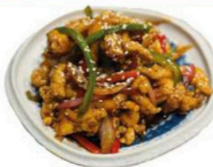
86. Pollo de la Casa Pollo salteado con verduras y sésamo 🌱 🍴 🍷