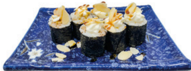
245. Maguro Foso Philadelphia Atún con philadelphia y almendras