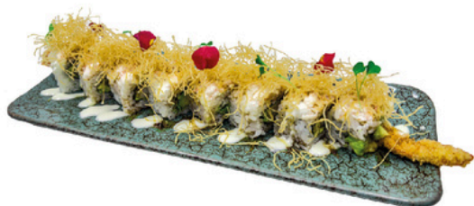
224. Dragon 4 unds Langostino empanado con aguacate y topping de surimi y salsas de la casa