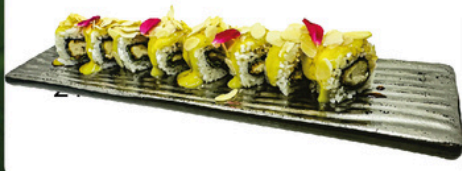
209. Nagoya 4 unds Uramaki con pollo, salsa de maracuya y láminas de almendra