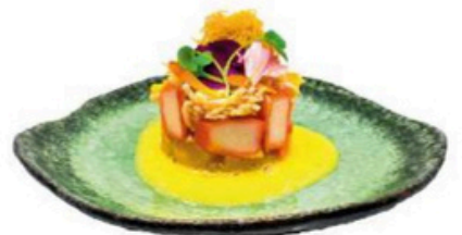
170. Timbal de Cangrejo Con salsa de maracuya y mango