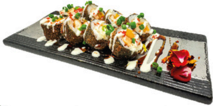
200. Imperial 4 unds Maki empanado con pollo y mango