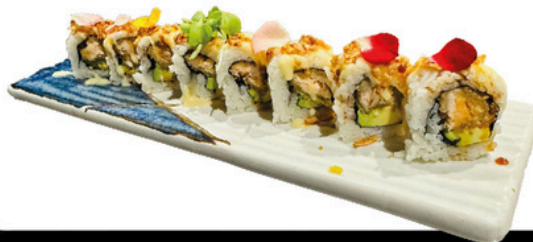
236. Salmon Cruwchy Roll 4 unds Salmon crocante, aguacate, con salsa de maracuya, teriyaki y cebolla frita