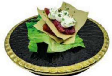
167. Sandwich de Atún Con philadelphia