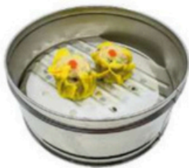
11. Syu Mai Saquitos de cerdo al vapor