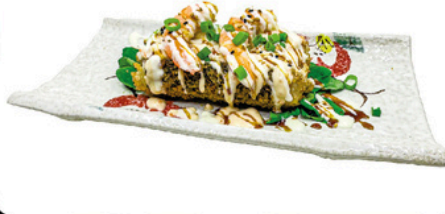
201. Hot Dog Maki empanado con philadelphia, surimi y langostino