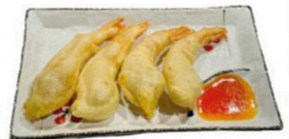
28. Langostino Frito 2 unidades