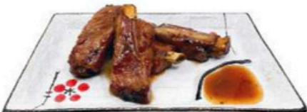
69. Costillas Agridulces