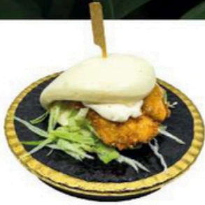
24. Bao Chicken Pan al vapor con pollo empanado 🌱 🍴 🍷