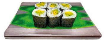
249. Foso de Aguacate