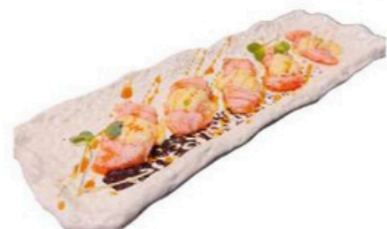
119. Sake Mayo Carpaccio de salmon flambeado