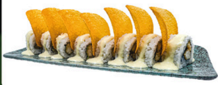
210. Dinosaurio 4 unds Uramaki con pollo, salsa de mostaza y patata crujiente