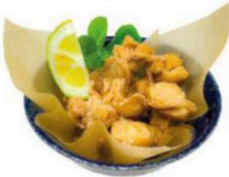
44. Tori No Karaage Pollo frito al estilo japonés 🌱 🍴