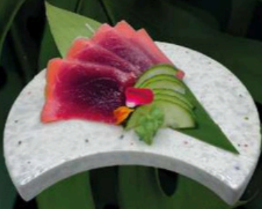
100. Sashimi de Atún