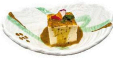
6. Hiyayakko Queso de soja con salsa de sésamo.