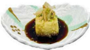
21. Agedashi tofu Queso de soja frito con salsa tempura