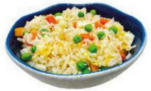
46. Cha Han Arroz tres delicias 🍴