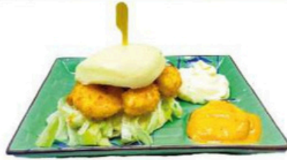
25. Ebi Bao Katsu Pan al vapor con gamba empanada 🌱 🍴 🍷