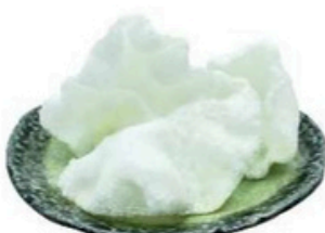
33. Pan de Gamba