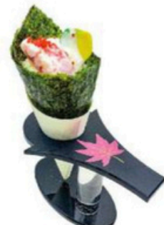
114 Temaki De langostino