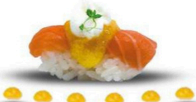
120. Sake Gourmet