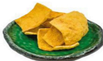
34. Crackers de Yuca