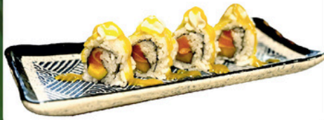
204. Philadelphia 4 unds Uramaki de salmon y aguacate con topping de philadelphia y salsa de mango