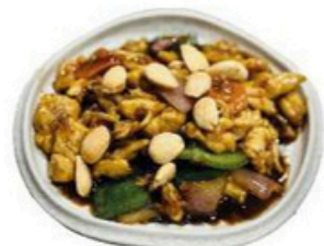
87. Pollo con Almendras Pollo salteado con verduras y almendras 🌱 🍴 🍷