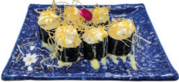
244. Foso Sake Philadelphia Salmon con philadelphia