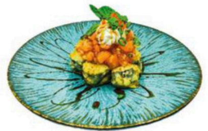
164. Kabuto Salmon picado sobre foso maki de aguacate tempurizado