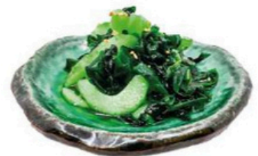
4. Wakame no Sunomono Alga marina y pepino con vinagreta