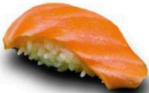
104. Niguri de Salmon