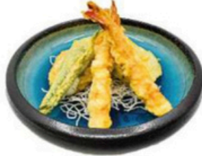
41. Tempura Mix Verduras y langostinos tempurizados 🌱 🍴 🍷