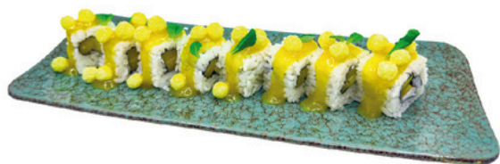
221. California Modern 4 unds Mango y pasta cangrejo con salsa de mango