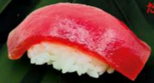
103. Niguri de Atún