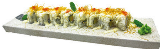
223. Sakai 4 unds Mango y pasta de cangrejo, mayonesa y tobiko