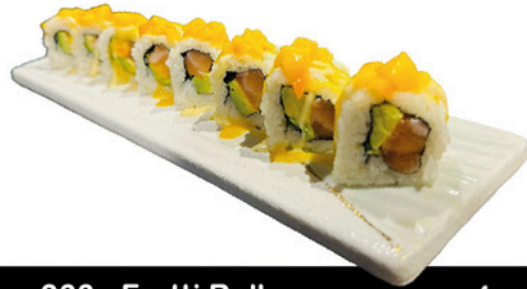
233. Frutti Roll 4 unds Salmon, aguacate y topping de mango