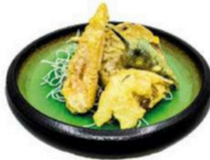
45. Tempura de Verduras 🌱 🍴