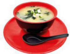
15. Miso Shiru Sopa de miso con queso tofu