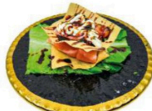
162. Sandwich de Salmon Con salsa de la casa y philadelphia