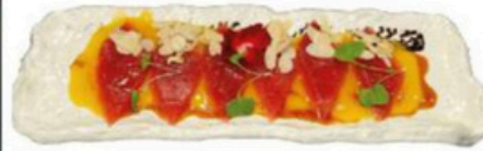
110. Carpaccio de Atún Filetes de atún y salsa de mango con almendras