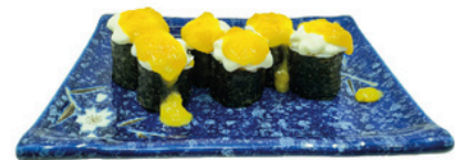
246. Foso Tropical Aguacate philadelphia y salsa de mango