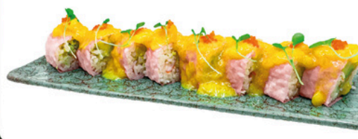
231. Cuento de la cometa 4 unds Cangrejo rayado y aguacate con lamina de soja y pure de mango