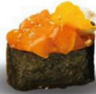
107. Gunkan Spicy Sake Salmon ligeramente picante con queso crema y mango