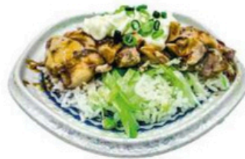
66. Pollo Nan Ban Don 🌱 🍴 🍷 🍴