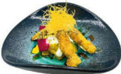
168. Kazan Palitos de atún empanados sobre aguacate y philadelphia