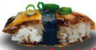
105. Niguri de Anguila