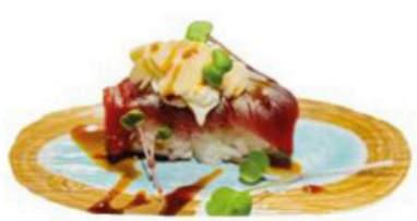
135. Maguro Deluxe

Atún con philadelphia, teriyaki y almendras