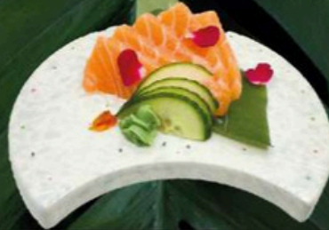
101. Sashimi de Salmon