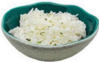
49. Gojan Arroz blanco