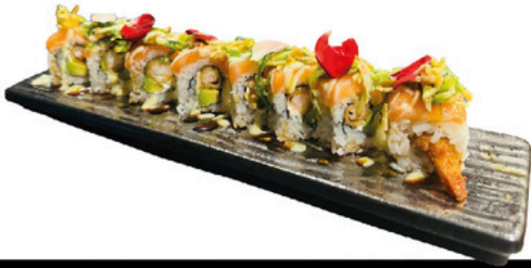
232. Galaxi roll 4 unds Gamba rebozada, aguacate y queso crema con topping de salmon y salsas de la casa