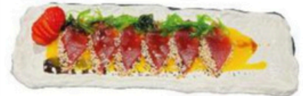
111. Carpaccio Tuna Filetes de atún, salsa de mango y sésamo