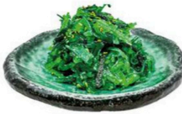
2. Goma Wakame