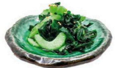
4. Wakame no Sunomono Alga marina y pepino con vinagreta 4,50€