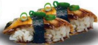
105. Niguri de Anguila 6,50€