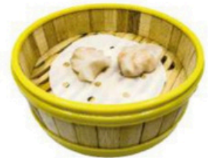
10. Hagao Empanadilla de gambas al vapor 5,00€