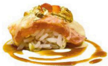
132. Sake Aburi Oro

Salmon flambeado, con laminas de oro, salsas de la casa y tobiko