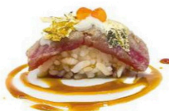
134. Maguro Oro

Atún flambeado, con laminas de oro, salsas de la casa y tobiko