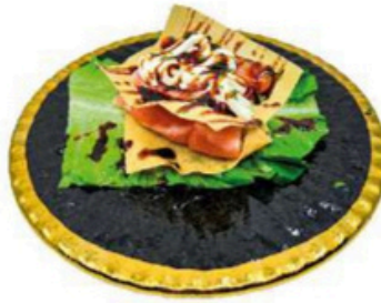
162. Sandwich de Salmon Con salsa de la casa y philadelphia 4,00€