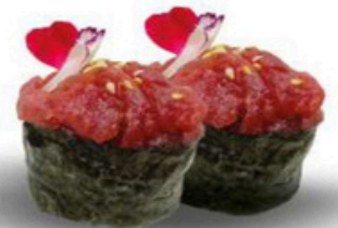
108. Gunkan de Atún Atún picado