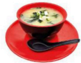
15. Miso Shiru 3,75€ Sopa de miso con queso tofu