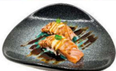
123. Niguri Aburi de salmon