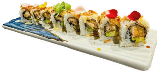
236. Salmon Cruwchy Roll 14,90€

Salmon crocante, aguacate, con salsa de maracuya, teriyaki y cebolla frita