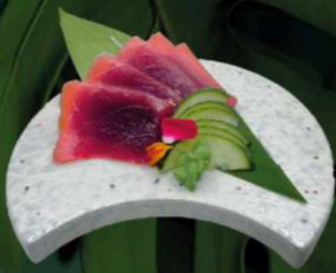
100. Sashimi de Atún 8,00€