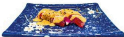
124. Niguri de Atún Spice