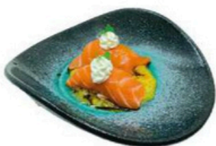
120. Sake Gourmet