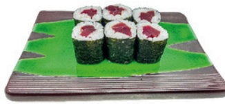
248. Foso de Atún