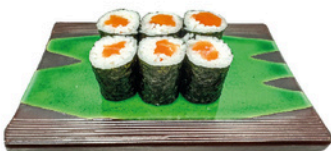
247. Foso de Salmon