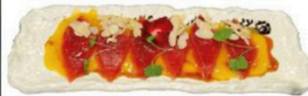
110. Carpaccio de Atún Filetes de atún y salsa de mango con almendras