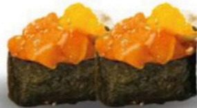
107. Gunkan Spicy Sake Salmon ligeramente picante con queso crema y mango