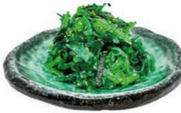
2. Goma Wakame 4,50€