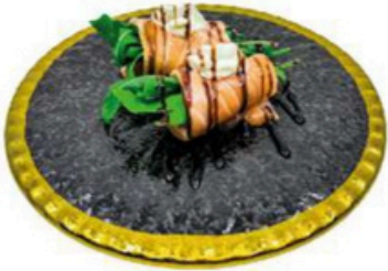
161. Flamenquines de Salmon Con salsa de la casa y philadelphia 5,00€