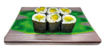
249. Foso de Aguacate