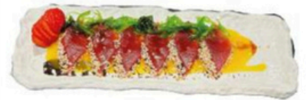
111. Carpaccio Tuna Filetes de atún, salsa de mango y sésamo