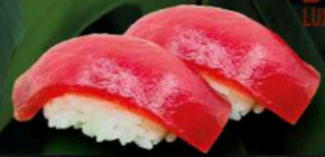
103. Niguri de Atún 4,00€