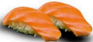
104. Niguri de Salmon 4,00€