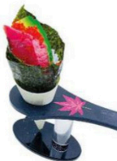
113 Temaki De atún