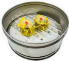
11. Syu Mai 4,50€ Saquitos de cerdo al vapor