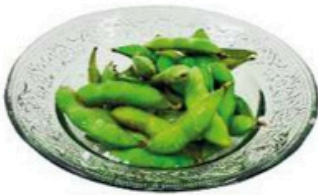
1 Edamame 5,00€ Judias al vapor