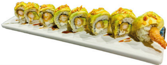
234. Ebi Avocado Roll 14,90€

Gamba rebozada, con queso crema, y topping de aguacate con teriyaki