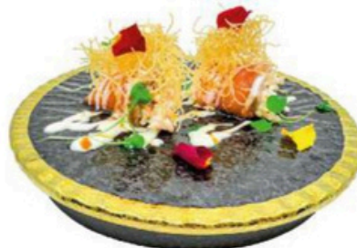
169. Canelon Salmon y Surimi Con salsa de la casa 5,50€