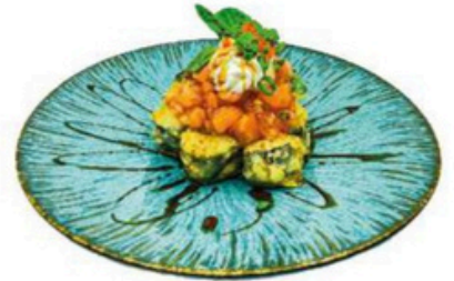
164. Kabuto Salmon picado sobre foso maki de aguacate tempurizado 17,90€