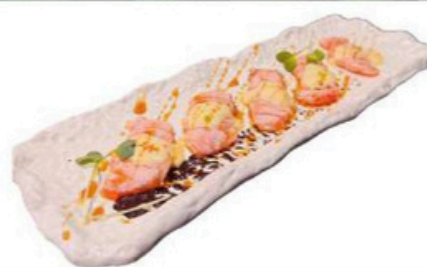
119. Sake Mayo Carpaccio de salmon flambeado