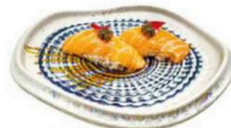
125. Niguri de salmon Trufado