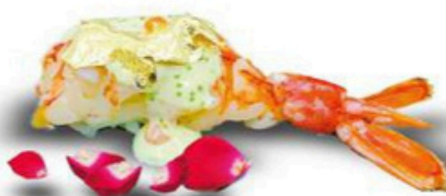
133. Gambon oro

Gambon flambeado con mayo de tobikko verde, laminas de oro y tobiko