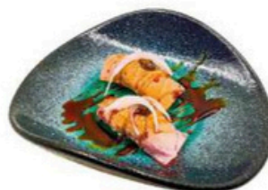
122. Niguri Aburi de Atún