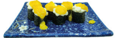
246. Foso Tropical