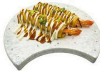
9. Ebi Roll Rollitos de langostino al estilo Daiwa 5,00€