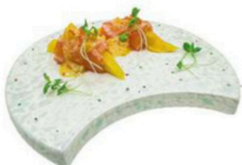
126. Rollitos de salmon