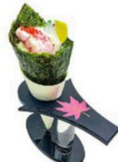
114 Temaki De langostino