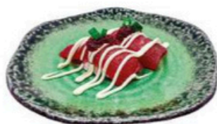
121. Maguro Gourmet