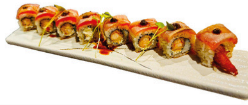
235. Maguro Trufa 14,90€