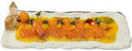
109. Carpaccio de Salmon Filetes de salmon, salsa de mango y trufa