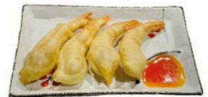
28. Ebi Fray Langostinos empanados 4,00€