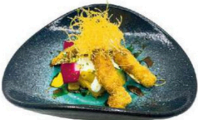
168. Kazan Palitos de atún empanados sobre aguacate y philadelphia 10,00€