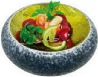
165. Boreal Finos cortes de atún, salmon y gambon 11,00€