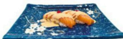
129. Niguri de salmon Spice