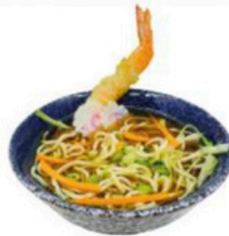
12. Tempura Ramen 5,50€ Caldo de Bonito con tallarines ramen y tempura