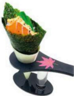
112 Temaki De salmon