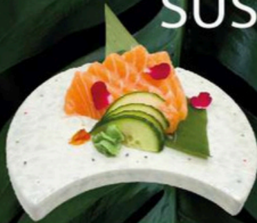
101. Sashimi de Salmon 8,00€