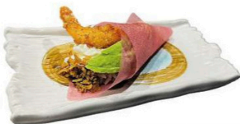
118. Temaki langostino tempurizado Aguacate, philadelphia, cebolla frita y teriyaki con papel de soja